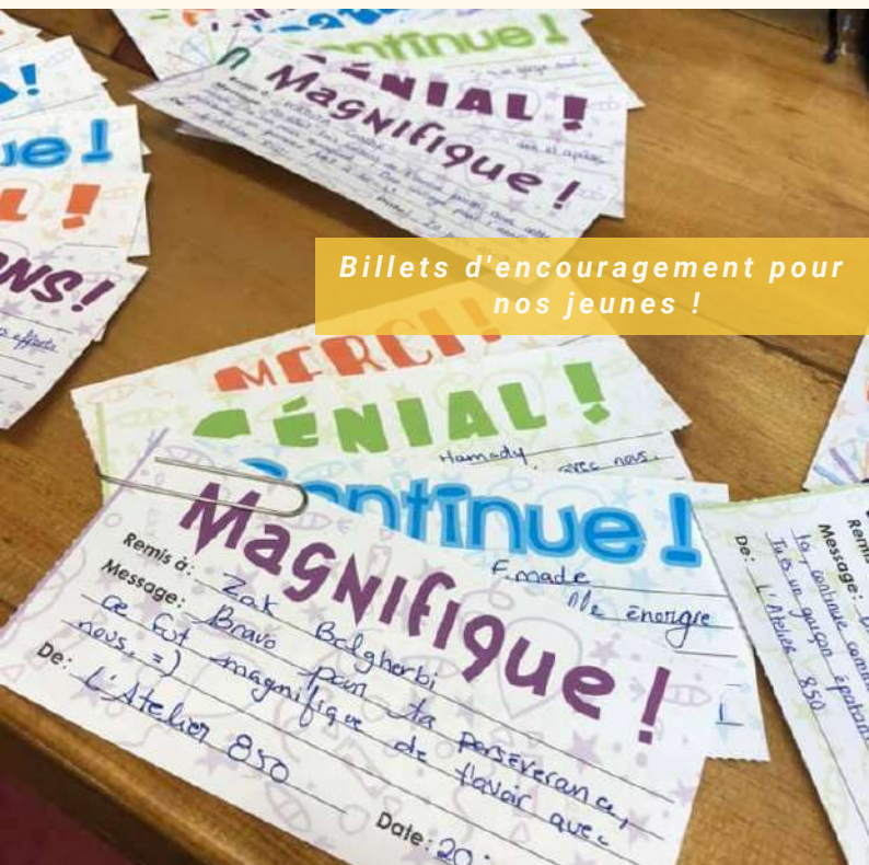
Billets d'encouragement pour nos jeunes !