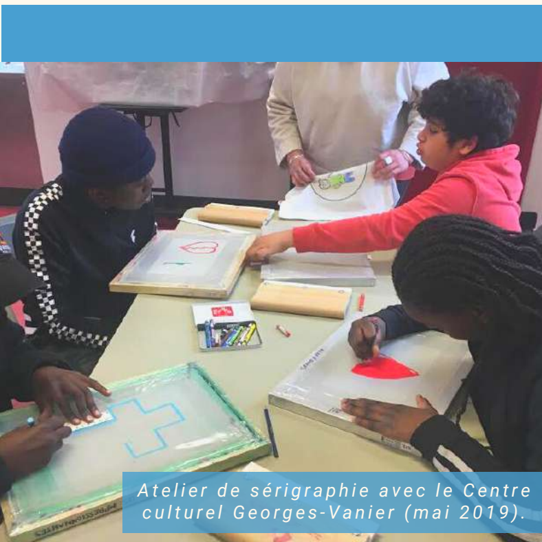
Atelier de sérigraphie avec le Centre culturel Georges-Vanier (mai 2019).

Ces ateliers structurés facilitent les échanges et l'intégration dans la vie locale et la communauté. Ils jouent un rôle important dans le cheminement de certains jeunes, dans leur nouveau milieu de vie et renforcent leur sentiment d'appartenance au groupe et au quartier. Ils permettent aux jeunes de découvrir de nouveaux loisirs et centres d'intérêt vers lesquels ils ne seraient peut-être pas allés spontanément ou auxquels ils n'auraient pas nécessairement eu accès.