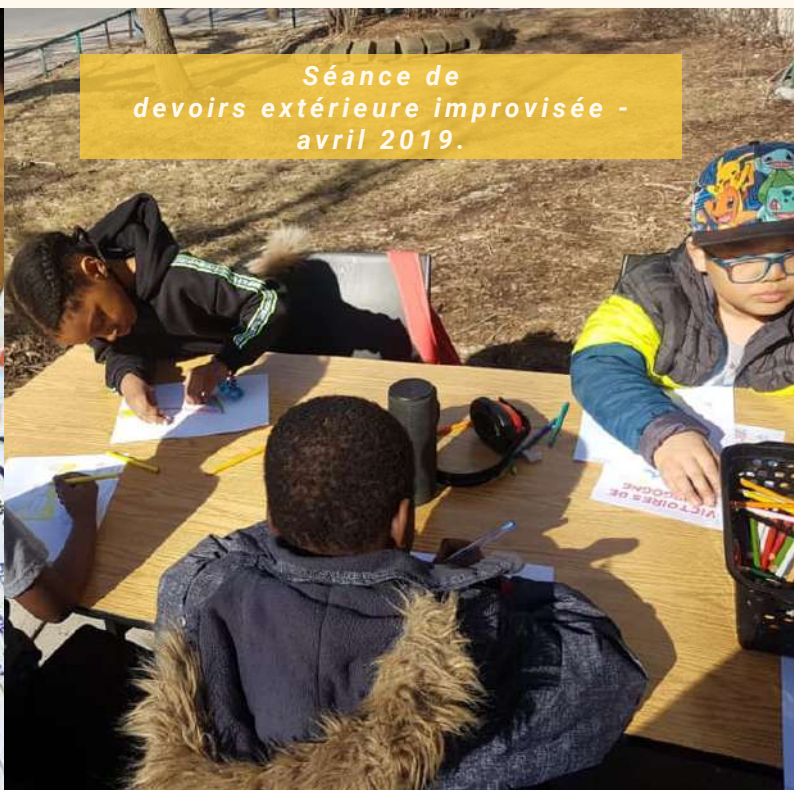
Séance de devoirs extérieure improvisée - avril 2019.