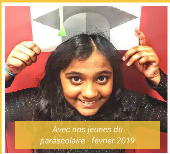
Avec nos jeunes du parascolaire - février 2019