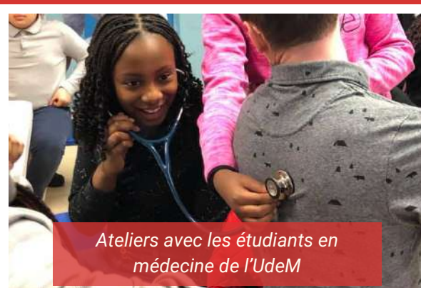
Ateliers avec les étudiants en médecine de l'UdeM

En fin février 2019, un groupe d' étudiants en médecine de l'UdeM est venu rencontrer nos jeunes du parascolaire pour de petits ateliers sur le corps humain . Merci à eux !