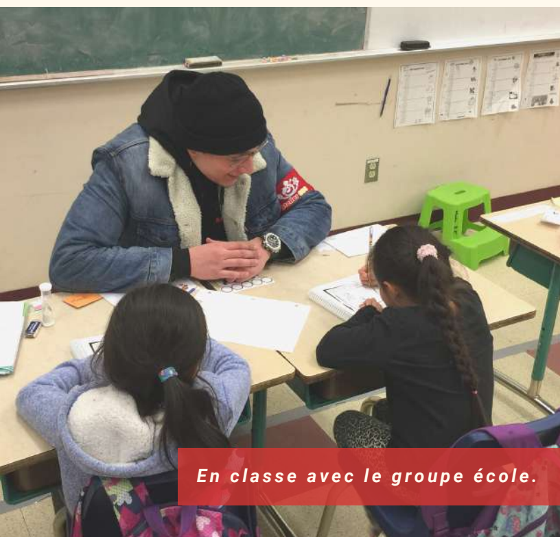
En classe avec le groupe école.

Certains enfants inscrits au Groupe École rejoignent par la suite le programme parascolaire de l'Atelier 850.