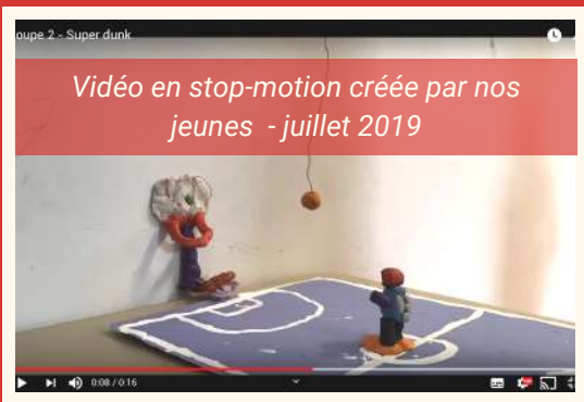
Video en stop-motion créée par nos jeunes - juillet 2019

Grâce au soutien du Gouvernement du Canada dans le cadre du Programme en matière de littératie numérique , l'Atelier 850 a lancé ses premiers Ateliers Branchés, de nouveaux projets informatiques proposés aux jeunes inscrit au programme parascolaire mais aussi à l'occasion du camp d'été !