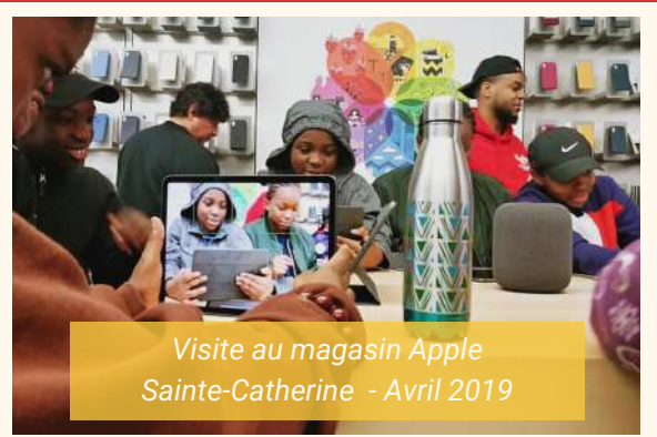
Visite au magasin Apple Sainte-Catherine - Avril 2019