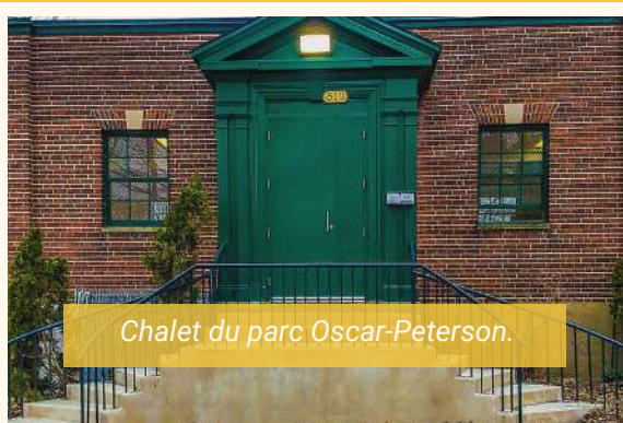
Chalet du parc Oscar-Peterson.